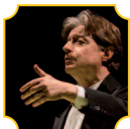
Roberto Abbado direttore

Sabato 16 ottobre, ore 17.30 • Domenica 17 ottobre, ore 18