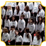
Coro Voci Bianche FOSS