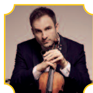
Stefan Milenkovich violino

Franz von Suppé (Spalato, 1819 - Vienna, 1895) Die leichte Cavallerie (Cavalleria leggera), ouverture