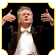
Hubert Soudant direttore

Venerdì 12 novembre, ore 21 • Sabato 13 novembre, ore 17.30