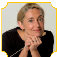
Nicole Paiement direttrice

Venerdì 7 gennaio, ore 21 • Sabato 8 gennaio, ore 17.30 Domenica 9 gennaio, ore 18 (fuori abbonamento)