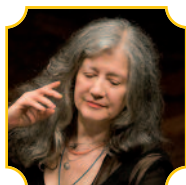
Marta Argerich pianoforte