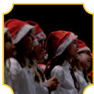
Coro di voci bianche FOSS

Giovedì 23 dicembre, ore 21 (fuori abbonamento)