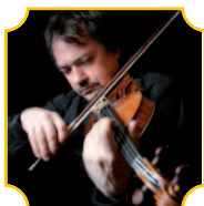
Sergej Krylov direttore/violino

Venerdì 5 novembre, ore 21 • Sabato 6 novembre, ore 17.30