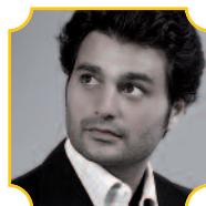
Stefano Sorrentino tenore

Sergej Rachmaninov (Oneg, Novgorod 1873 - Beverly Hills, 1943) Sinfonia n. 2 in mi minore, op. 27