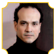
Egisto Javier Tomé tenore