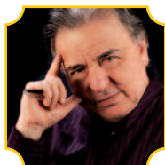
Donato Renzetti direttore

Venerdì 14 gennaio, ore 21 • Sabato 15 gennaio, ore 17.30