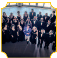
Coro Lirico Siciliano